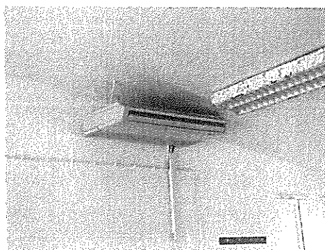
Fig. 2 – AC na zona de refeições