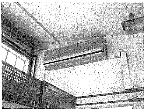
Fig. 1 – AC na cozinha